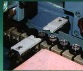
レンズ加工ライン