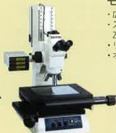
MF-Uシリーズ (金属顕微鏡タイプ)