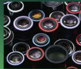
ミットヨの様々な光学レンズ