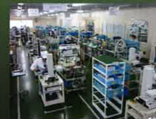
顕微鏡本体組立ライン