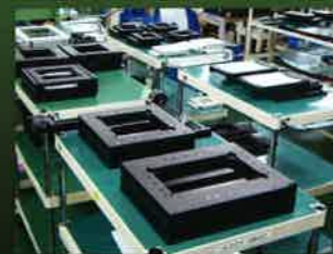
テーブルユニットの製造