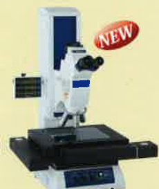
MF-Uシリーズ (金属顕微鏡タイプ)