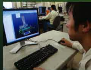
顕微鏡本体の設計